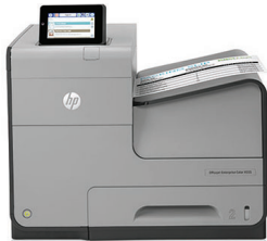
HP Officejet Enterprise Color X555dn nyomtató

Forradalmi nyomtatási technológia vállalata számára. A színes lézernyomtatóknál akár kétszer gyorsabban nyomtathat színes dokumentumokat, fele akkora oldalankénti költség mellett 1,2 . A fejlett biztonsági megoldásokat és teljes körű felügyeletet biztosító vállalati nyomtató élettartama rendkívül hosszú.