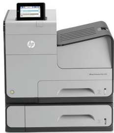
HP Officejet Enterprise Color X555xh nyomtató