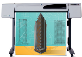
HP Designjet 550 42" (107 cm)